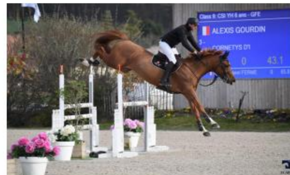
Cornetys d'I, agilité, force et courage.

2017 • Alezan • 1,71m • CHS, par Cornet du Lys x Toulon x Tanaël du Serein