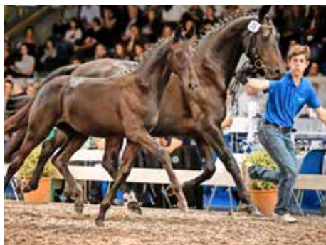
Giada Nera RR CH wechselte für 16000 Franken die Hand.

Giada Nera RR CH a trouvé un nouveau propriétaire pour Fr. 16000.-