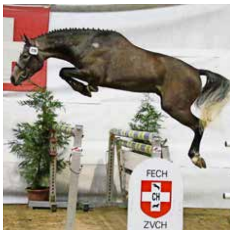
Lex v. Quellhof – Sieger Freispringen. Lex v. Quellhof – vainqueur saut en liberté.