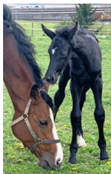
Dia Cortina DP CH: Diacontinus – Lordanos – Landor S

Fohlenchampionnat 2021: | Championnat des poulains 2021: