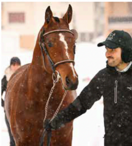
L'étalon Cedric , vainqueur de la sélection 2026, et son éleveur affrontent la météo hivernale sur la place de concours de Glovelier.

La 65 e édition de la Sélection nationale des étalons de la race franches-montagnes a eu lieu le 10 janvier à Glovelier, dans des conditions météo très hivernales. 40 candidats ont été présentés devant la commission d'experts et 12 ont été admis à poursuivre le processus d'approbation. Ces élèves-étalons sélectionnés se rendront à Avenches pour la deuxième étape. Au terme des quarante jours d'évaluation, l'approbation définitive des nouveaux étalons reproducteurs se tiendra le 28 février au Haras national.