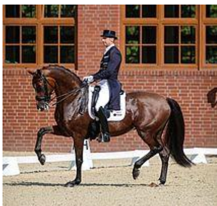
Well Done de la Roche CH