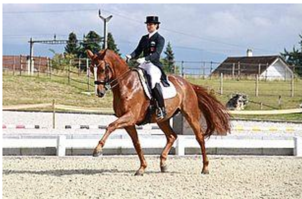
Dandy de la Roche CH