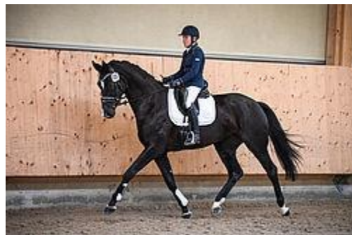
Paella vom Schlossgut CH v. Fürstenball – Gribaldi gewann 2017 das SBC in den Grundgangarten.