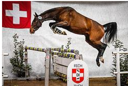
Chamane V.B. CH v. Chameur – Cape Canaveral war 2017 Sieger im Freispringen.