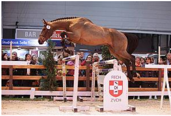
Graffiti de Chatigani