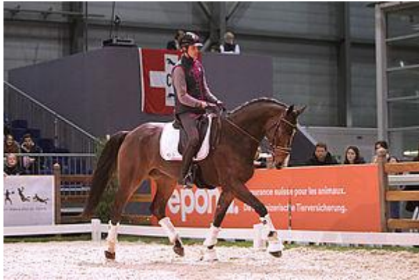
Once Upon a Time de Monfirak