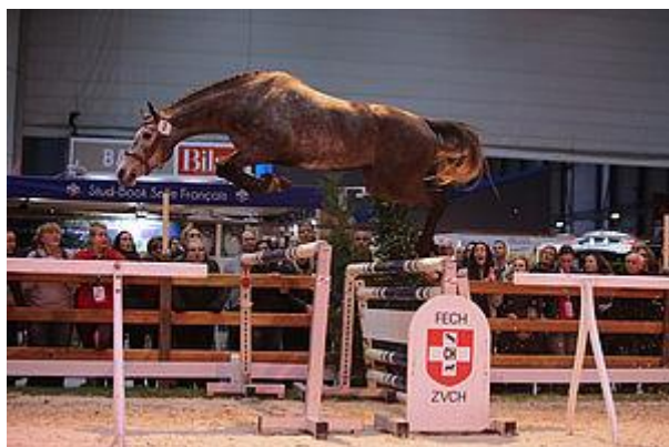
Comme la lune