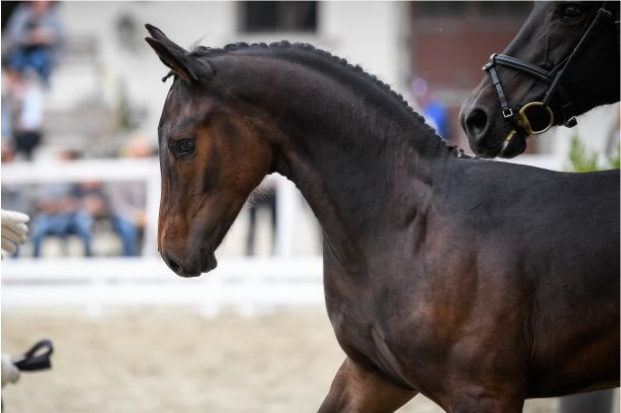
First Dream Blu CH par For Romance & U.S. Latina par Rubin-Royal – Landjonker – né en 2020